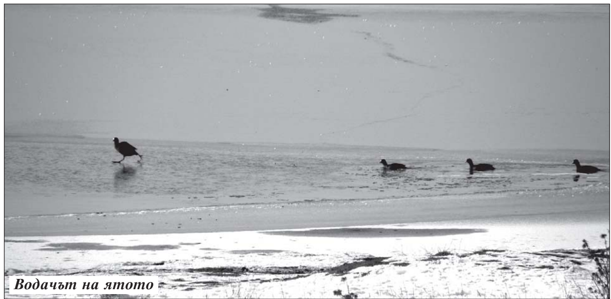
Водачът на ято

зиканти. По този начин инструменталната формация функционира и се афишира като симфоничен оркестър и може да изпълнява по мащабни творчески задачи.