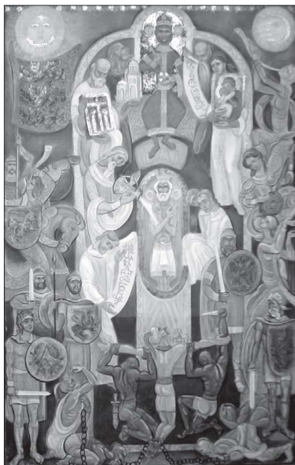
Художник: Людмил МЛАДЕНОВ

В дискусиата участваха представители на общинската администрация, директори на училища, ръководители на културни и просветни институции, читалищни дейци, творци.