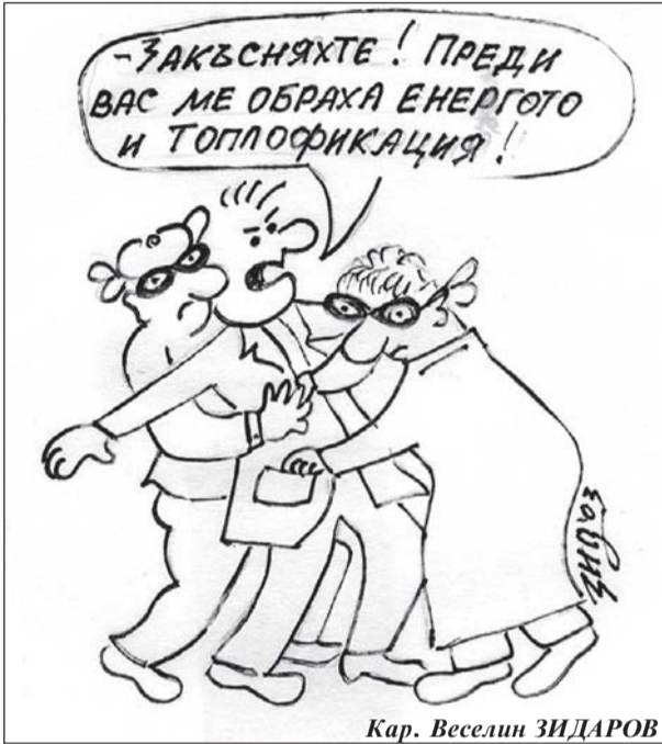
Кар. Веселин ЗИДAROV