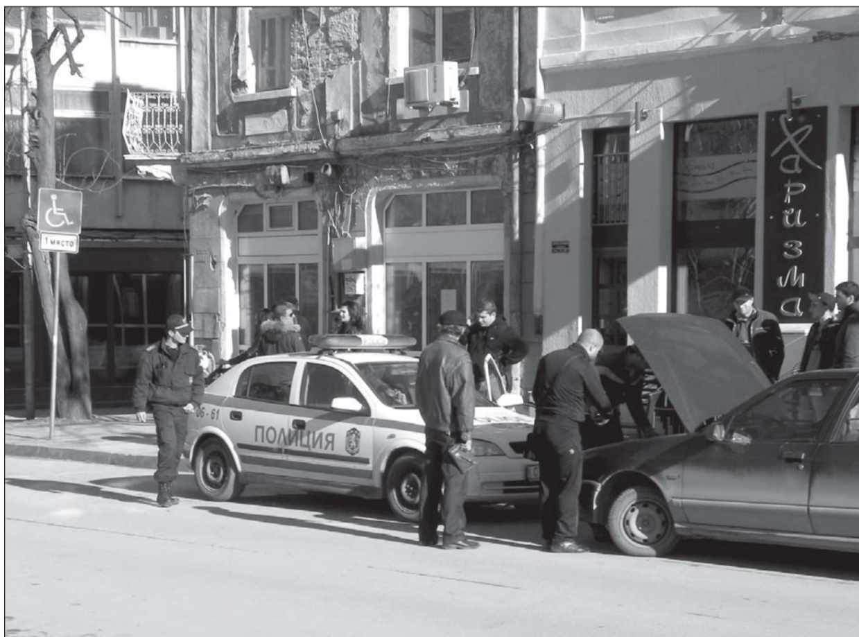
124 автомобили са проверили служителите от КАТ в неделя. В нарушение са били 71 водачи.

Награждаване ще стане на 28 февруари 2011 година от 19:00 часа в Младежкия дом.