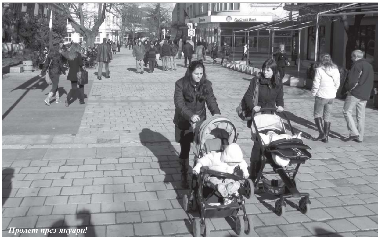
Пролет през януари!