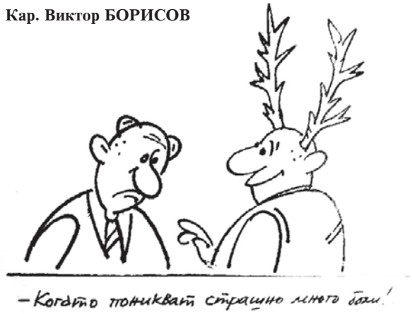
- Когато поникват страшно много бани!