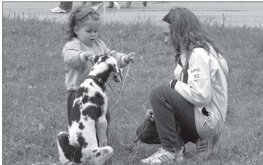
Международна киноложка изложба, организирана от Българския републикански киноложки съюз, се проведе на спортния комплекс "Христо Ботев" във Враца на 22 май.