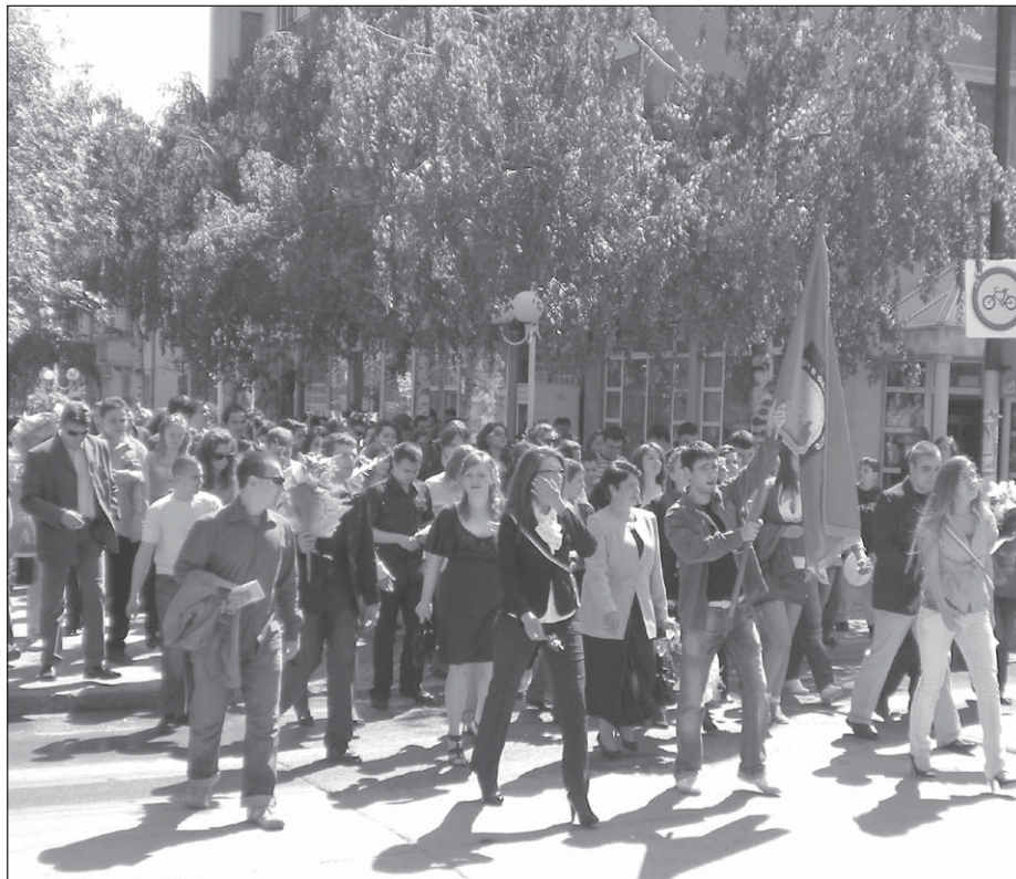
Над 70% от абитуриентите от ПМГ "Акад. Иван Ценов" вече са приети във висши учебни заведения у нас и в чужбина.