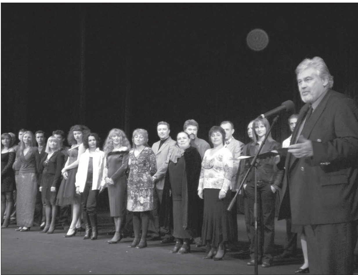
Министърът на културата проф. Стефан Данаилов поздрави врачанските театри със 70-тата годишнина на един от най-старите културни институти - Врачанският театър.

шък. Върху изплащателните картони на реда за месеца пенсионерите ще трябва да се подписват на две места - за редовната месечна пенсия и за допълнителната сума от 150 лв. Сметките на пенсионерите, които получават пенсиите си по банков път, ще бъдат заверени на 3 декември.