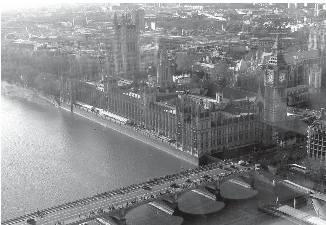
От следващия брой очаквайте пътните бележки на Марин БОТУНСКИ "В страната на Шекспир"