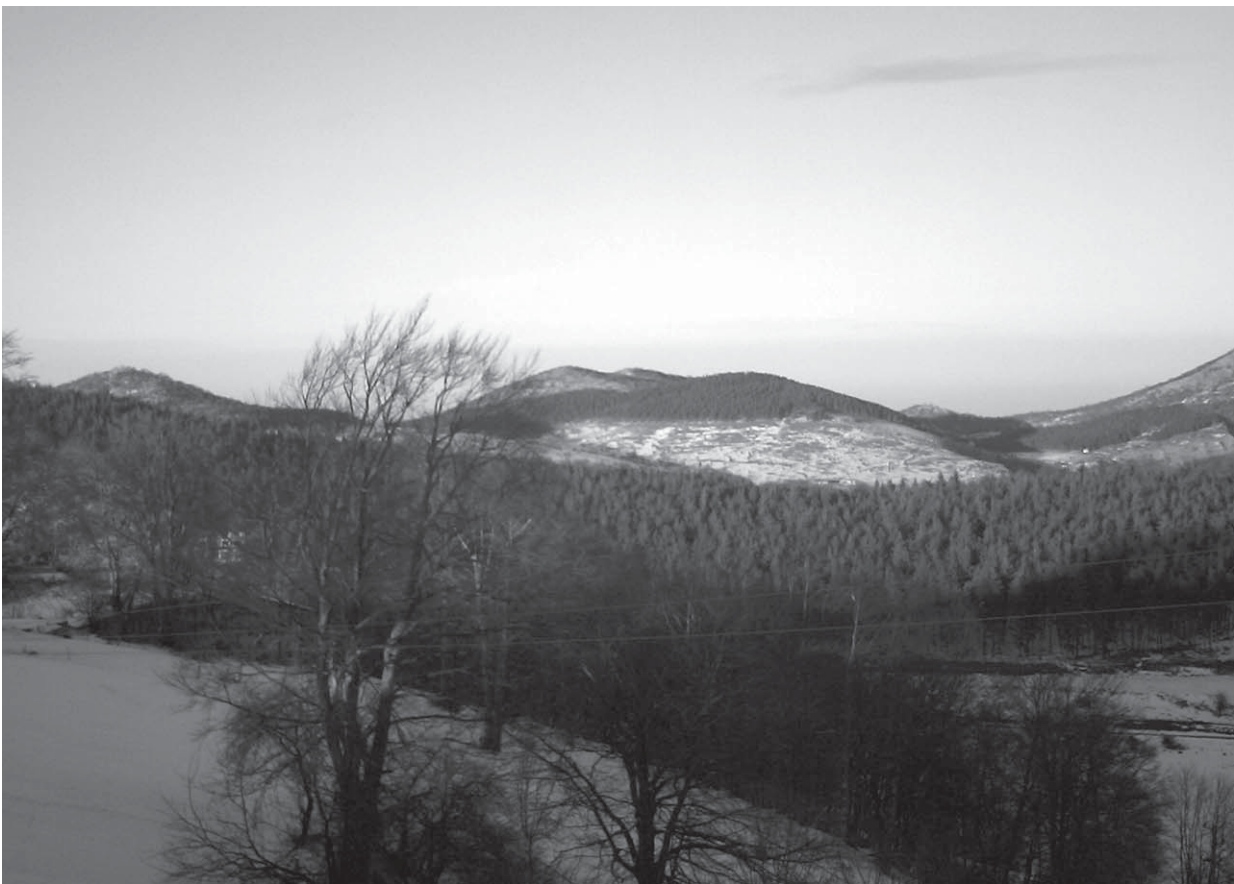
Въпреки, че в местността "Учителски колонии" снегът отстъпи пред топлия вятър, през уикенда много любители на белите спортове се отправиха към "Пършевица", където дебелината на снега все още бе подходяща за ски.

Оценката е, че АЕЦ "Козлодуй" е с доказан международен престиж на сигурен и ефективен производител на екологично чиста енергия и е надежден доставчик, който чрез ефективно управление на производството и продажбите заема място сред най-добрите европейски търговци.