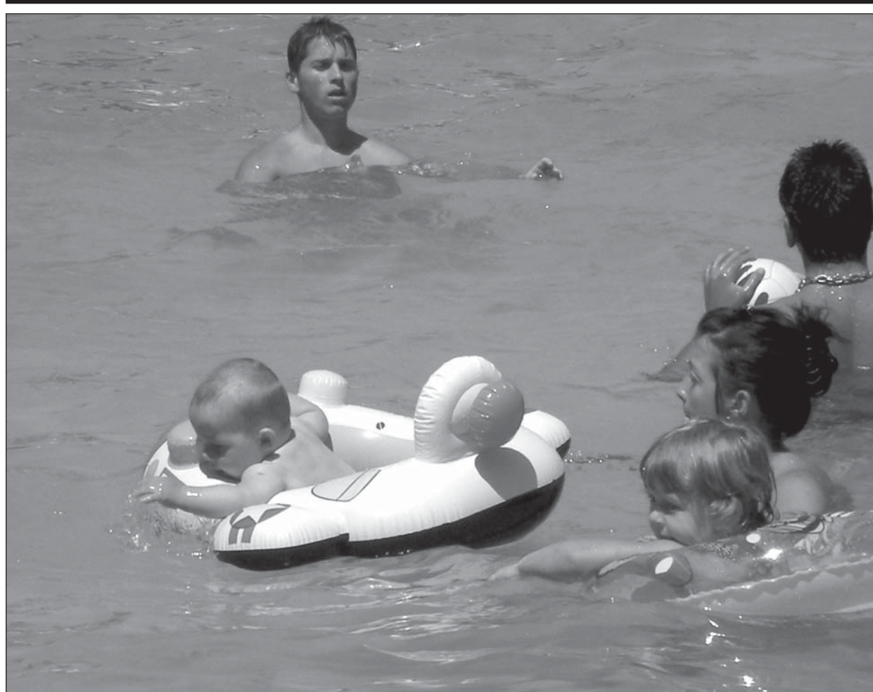
И най-малките врачани търсят прохлада в жегите

Сега едното от местата, където могат да упражнят етичното си чувство, е България.