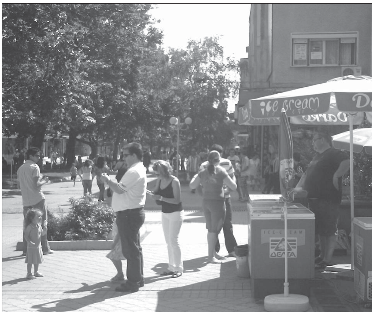
Стоян Дадов предлага разхлада на врачани в горещите юнски дни.