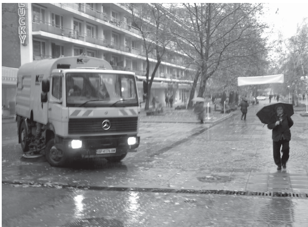
Колкото и да са настойчиви от "БКС", врачанският боклук е неизчерпаем...