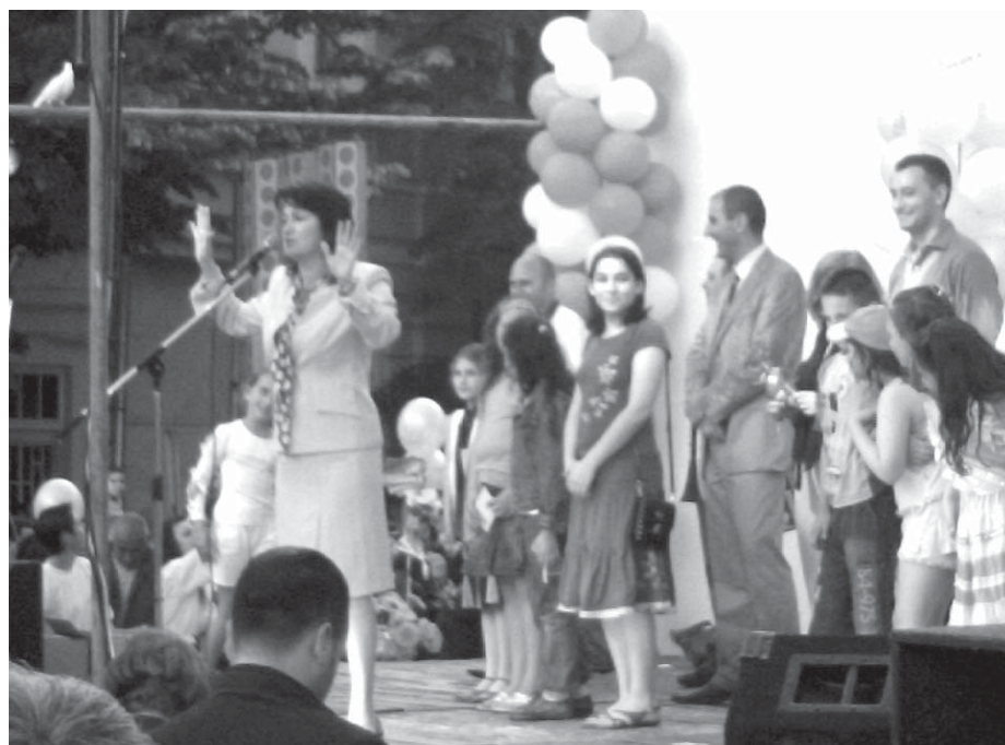
Много врачани повярваха на ГЕРБ