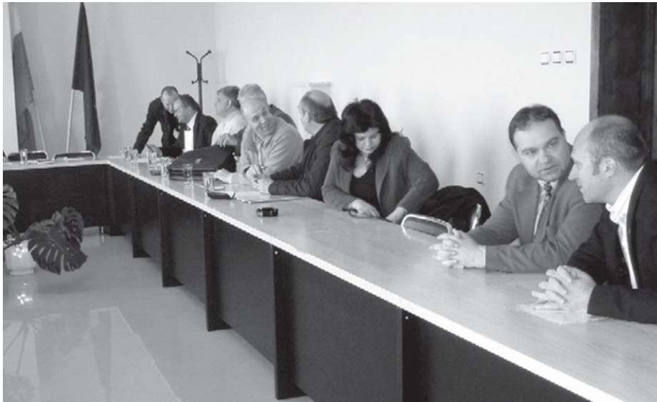
На консултациите между парламентарно представените политически сили в понеделник се реши Районната избирателна комисия във Враца да е от 13 човека, а разпределението на квотите да е като на президентските избори. Председателят на РИК ще е от Коалиция "За България", зам. - председателят - от НДСВ, а секретарят - от ДПС.

Кристинян Вигенин е водачът на листата на БСП за изборите за Европейски парламент (ЕП), депутатът Илияна Йотова е на второ място. Това реши в петък Изпълнителното бюро (ИБ) на социалпартията. На челните избираеми места са още и досегашните евродепутати Евгени Кирилов, Атанас Папаризов, Георги Близнашки, Маруся Любчева и др.