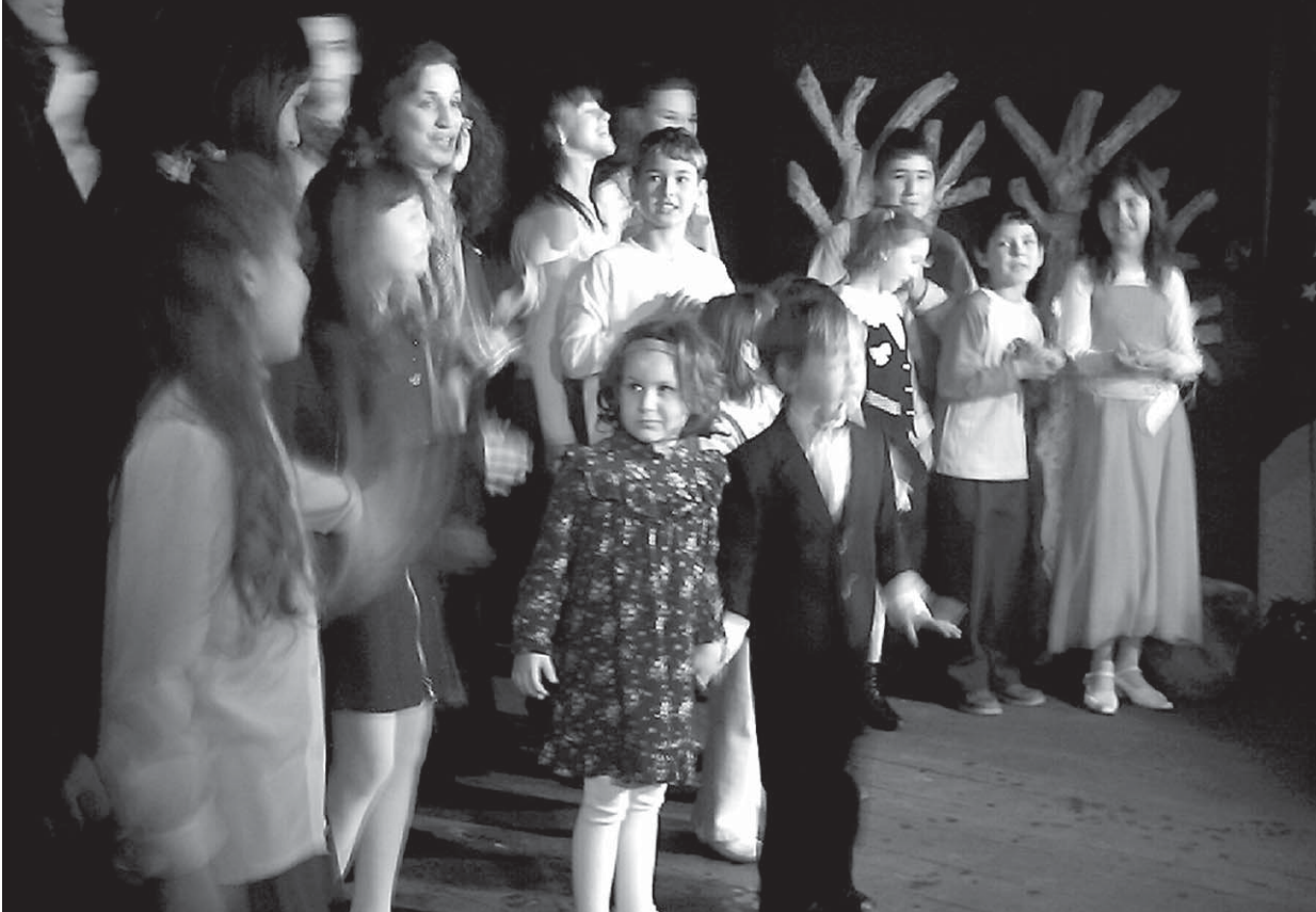
На 25 март, на светлия християнски празник Благовещение, отвори врати обновеният салон на театър "Пионер".