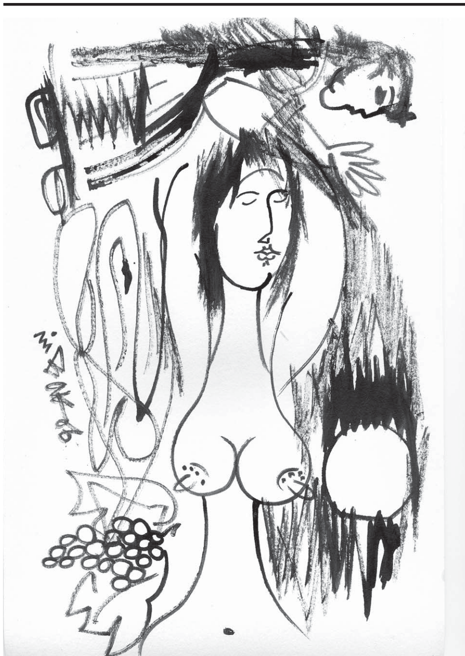
Рис. Тодор Ваков

Ах, колко кръв има върху ножа! И върху хляба колко сълзи!