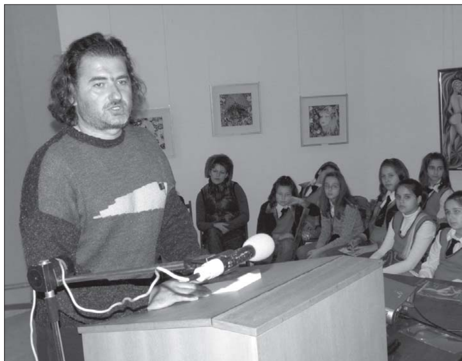
На 24 ноември, в Регионалния исторически музей - Враца беше представен биографичния роман за гениалния български цигулар Васко Абаджиев - „Шакона Пасион“ от Маргарит Абаджиев.