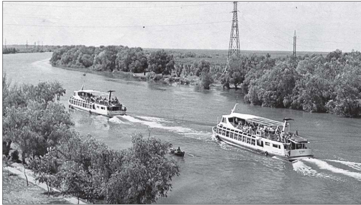
Красива е дунавската част преди укротените на финала води да навлезат в Черно море

бъдеще. Винаги непозната, нова и загадъчна, предизвикваща емоции - такава е Великата река! Старите казват, че животът е цялостен - всяка негова частица е свързана с другата. Не унищожавай, човече, тревите, не мърси водите, не убивай птиците, в противен случай непрекъснато ще убиваш себе си.