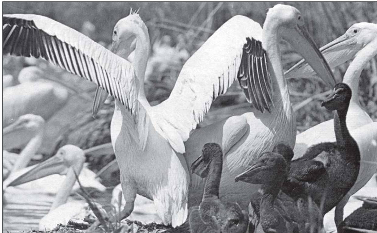
Живата природа на живописната и уникална делта

Обичам Дунава! Тази втора по големина в Европа река и двадесет и седма по дължина в света. Опи-вал съм се от хубостите по цялото й протежение, от изворите в германската планина Шварцвалд до устието й в старинна Сулина, където е тържественият й финал. Няколко държави и десетки цветущи селища прекосява Дунав в 2 860 километрова си път, приличащ на улица с двупосочно движение. История и живот, настояще и