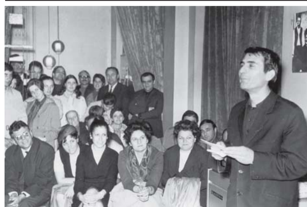
Ден на хумора и сатирата, 1 април, КДК - Враца

И пак челата ви се вдигат остро, и гърбовете ви не се пречуват под гибелното бреме на страха. И нека звяр и камък да си мислят, че свършено е с вас. И жалък червей да остри за плътта ви своя зъб. Вий ще пребродите до дъно ада от яростни фъртуни, от самотност, от неми снегове и безнадеждност. Април изправени ще ви намери, в сърцата ви премръзнали да влее от слънчевата животворна кръв.