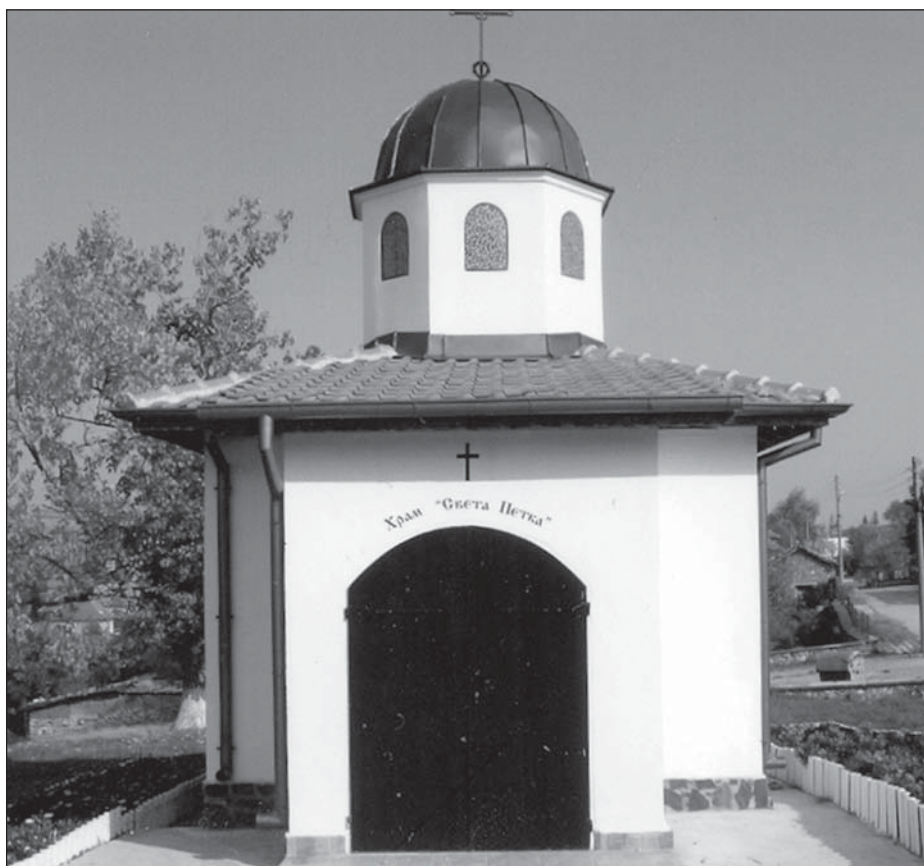
На 28 октомври в село Три кладенци се откри новопостроеният параклис "Света Петка".

и състави приемно-предавателен протокол. Петгодишният срок на договора на наемателя - Клуб "Олимпиец" изтече на 22.04.2008 г. и едва през октомври наемателят е открит за предаване на имота. С отпадането на последните формални пречки вече може да се пристъпи към изпълнение на решението на Общинския съвет за използването на сградата.