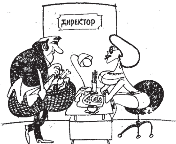
-Кажу на шефо, че идем по един хаплив въпрос.