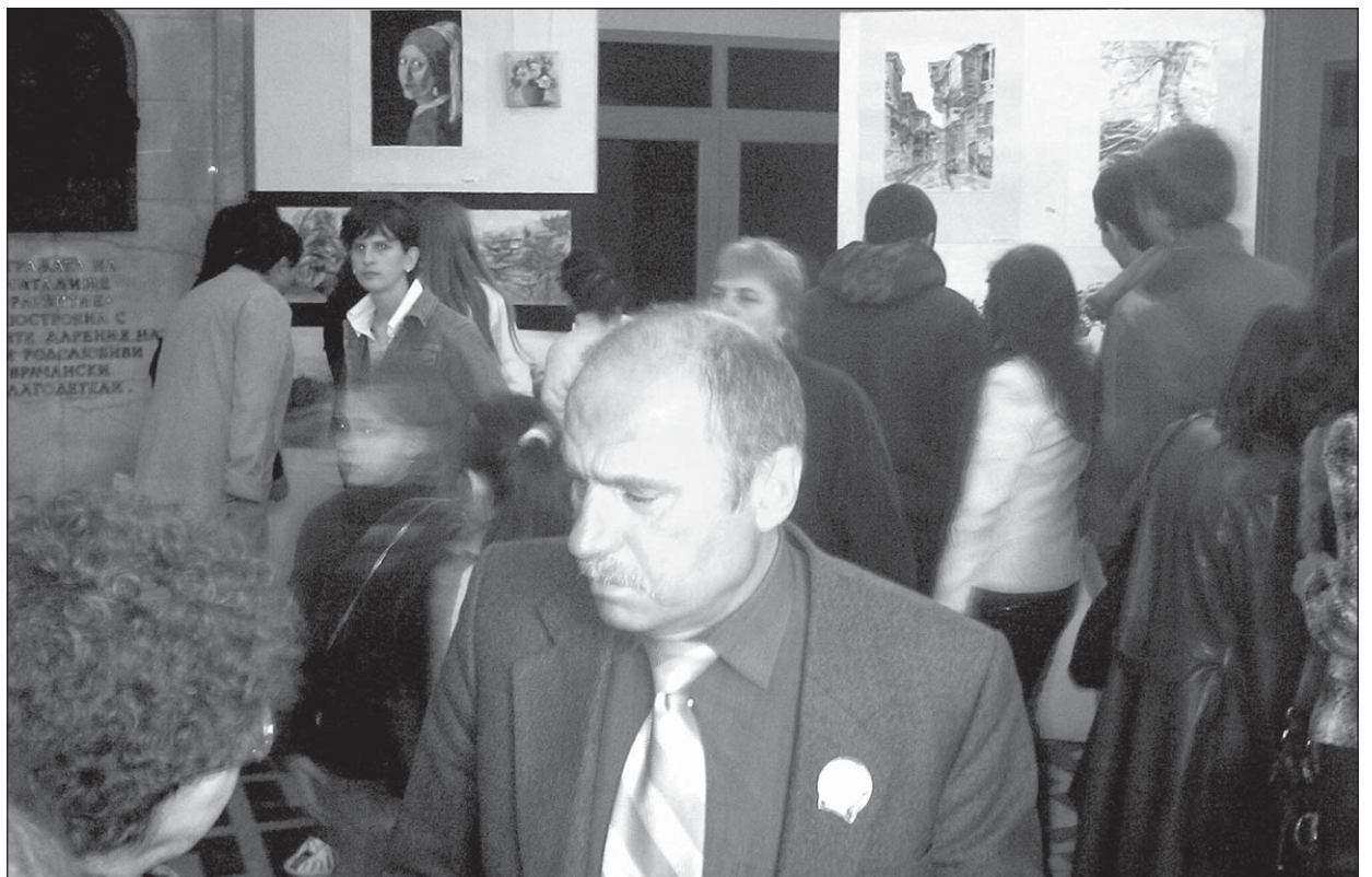
Великенска изложба-базар на рисунки, графики, витражи и изделия на приложното изкуство подредиха във фойето на Читалище "Развитие" учениците от горните класове от СОУ "Отец Паусий" на 14 април.

Искам да срещам изгрева с пълна раница, с дух преситен и да няма за мене граница между слънцето и браздите.