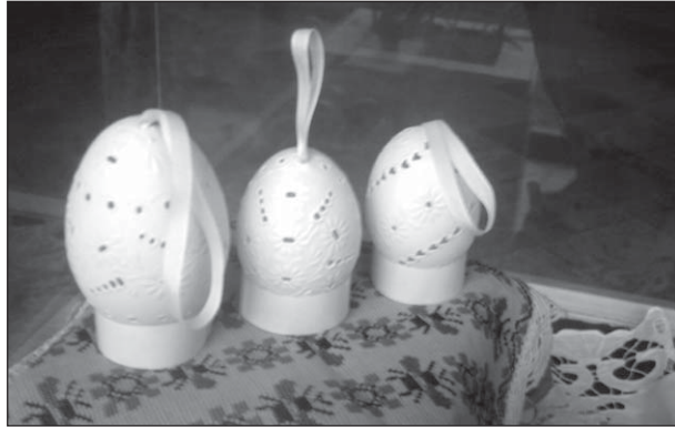
През изминалата седмица във фойето на РИМХГ се откри изложба "Великденски писани яйца" на Исторически музей от гр. Велинград.